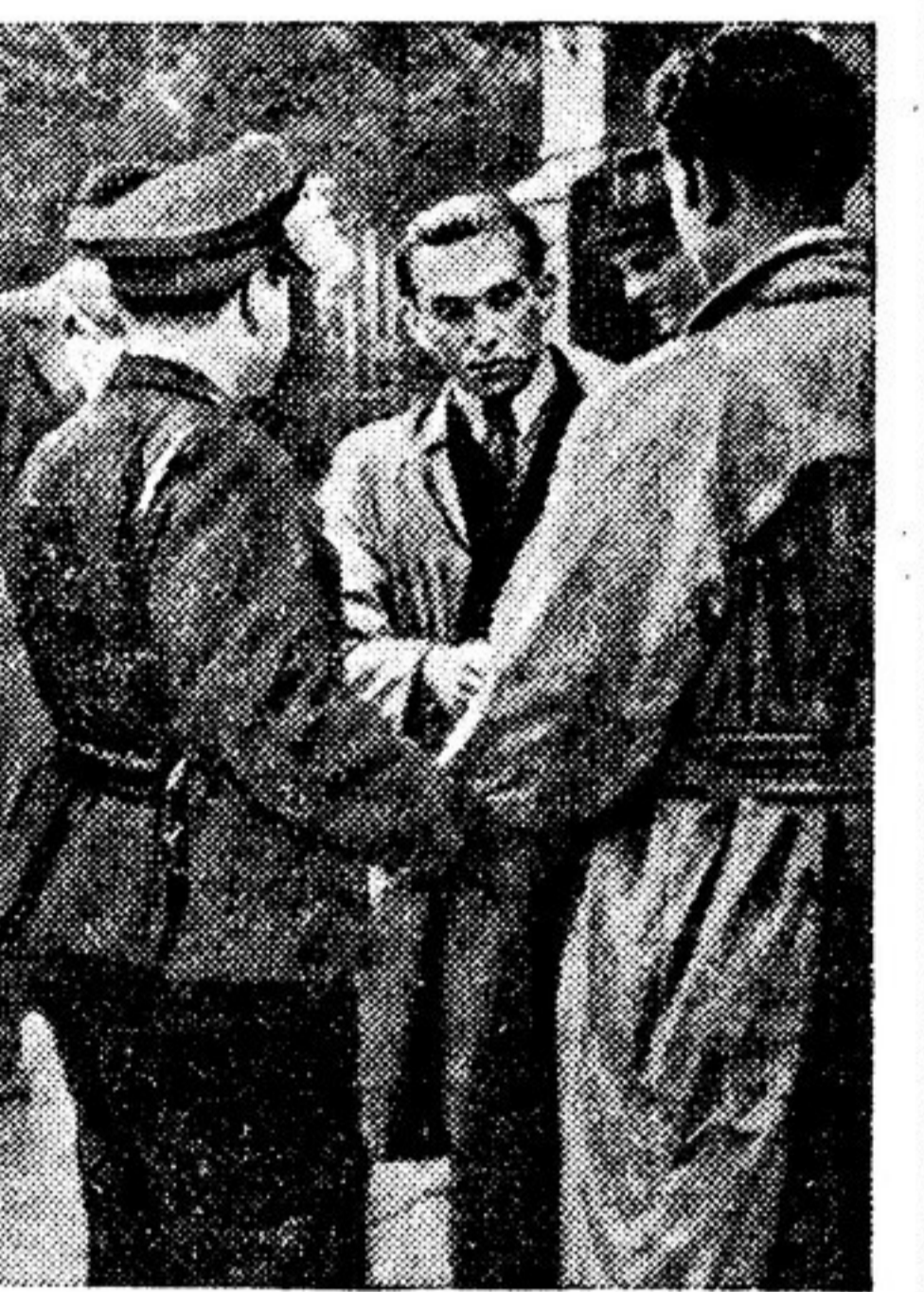
2. Полиция пытается пошевелить рабочих выразить свое отношение к ремилитаризации

Итак — повсюду. Сопровождение германского населения планам подготовки войны вызывает беспорядочность на Уолл-стрит.