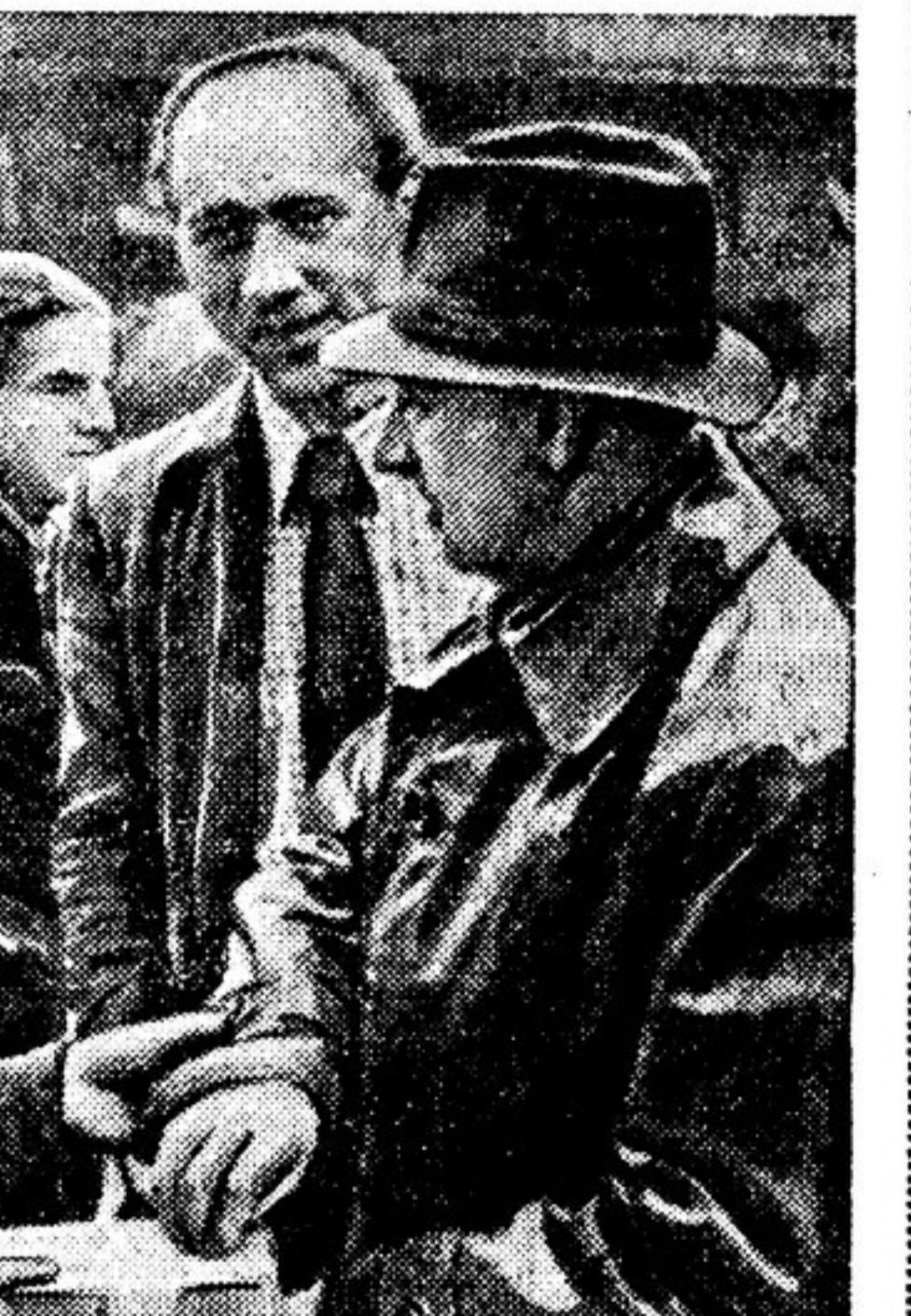
3. Усилия полицейских оказались тщетными: подавляющее большинство рабочих завода «Бюснинг» высказалось против перевооружения страны, за заключение мирного договора с Германией в 1951 году